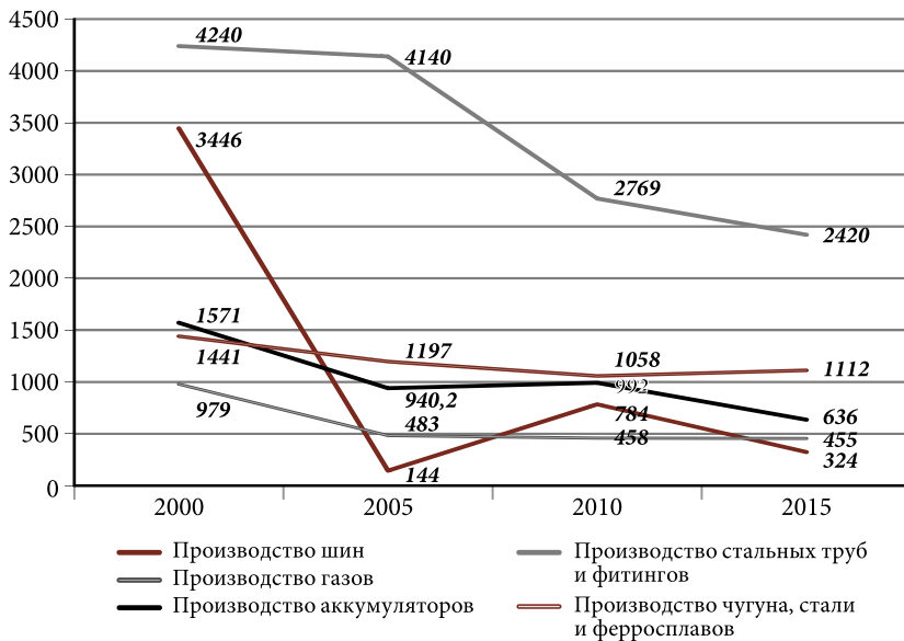
Рис. 2. Динамика индекса Херфиндаля–Хиршмана

Проанализируем показатели дисперсии рыночных долей и монопольной власти (табл. 3). Значения дисперсии (высокое значение показателя) показывает неравномерность распределения рыночных долей между участниками рынка. Согласно проведенному анализу (см. табл. 3), наибольшая неравномерность рыночных долей свойственна таким отраслям, как производство резиновых шин и стальных труб и фитингов.